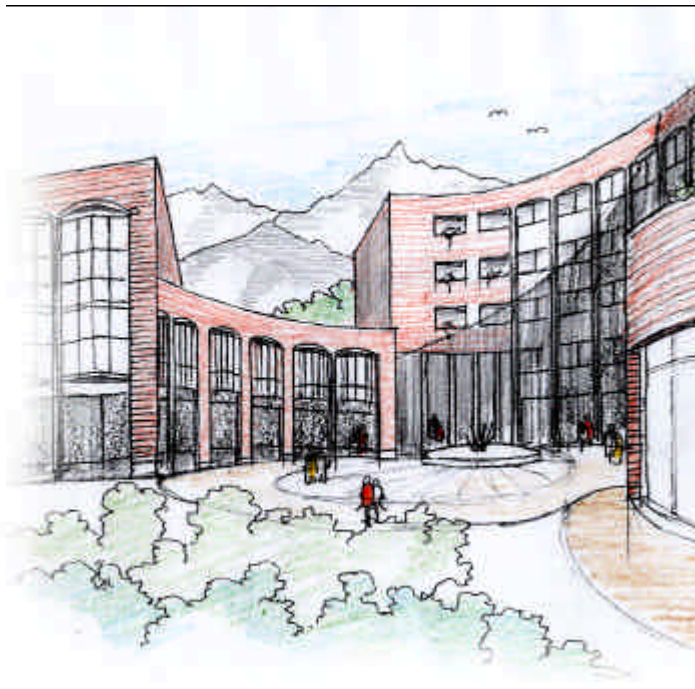
Sopra | Il progetto del complesso.

Dati dimensionali: Superficie coperta: 2.623 mq Volume fuori terra: 34.560 mc